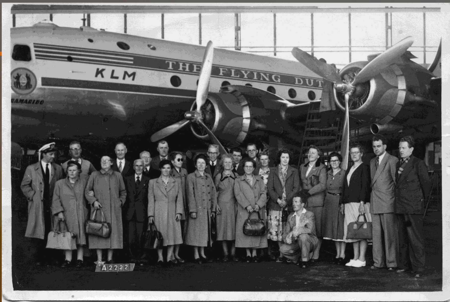
Bezoek Schipholmuseum 1954